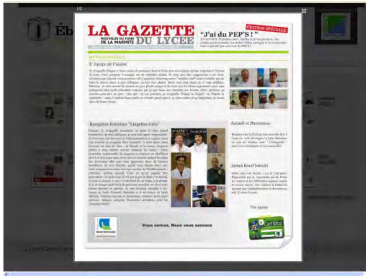
Affiches du personnel avec celles des élèves

“ Ebullitions un outil pédagogique FÉDÉRATEUR ” • Partager son expérience...ÊTRE CITOYEN • Source de cohésion sociale